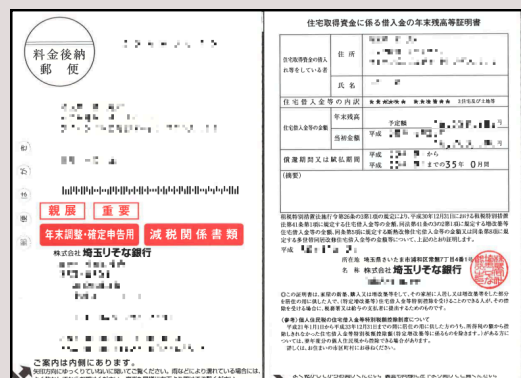
Juutaku loan yuushi gaku zandaka shoumeisho certificado de saldo de empréstimo imobiliário *O banco envia pelo correio todos os anos entre mês 6 e 10