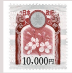
Contrato da casa Que tem o selo