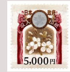
Contrato do terreno Que tem o selo